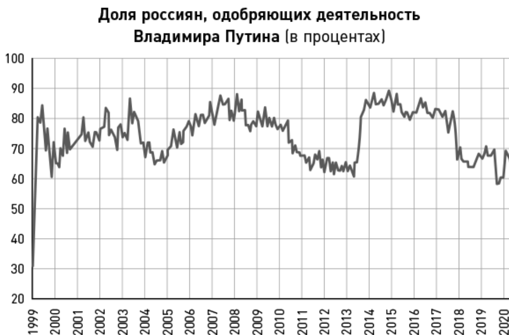
График 2. Россияне одобряют Путина

Источник: Левада-центр. Одобрение деятельности Владимира Путина ( https://www.levada.ru/indikatory/odobrenie-organov-vlasti/ ).