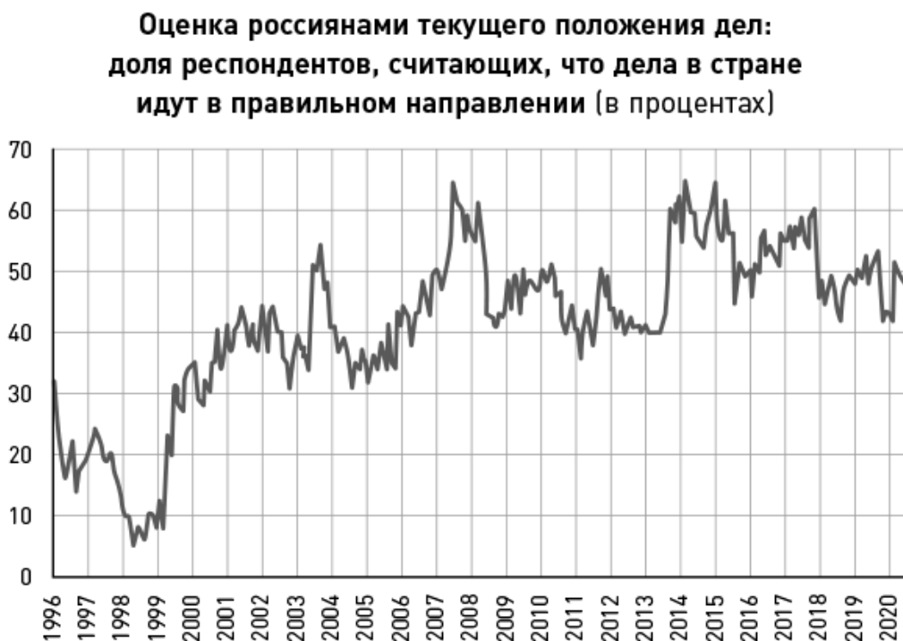
График 3. Страна развивается в верном направлении