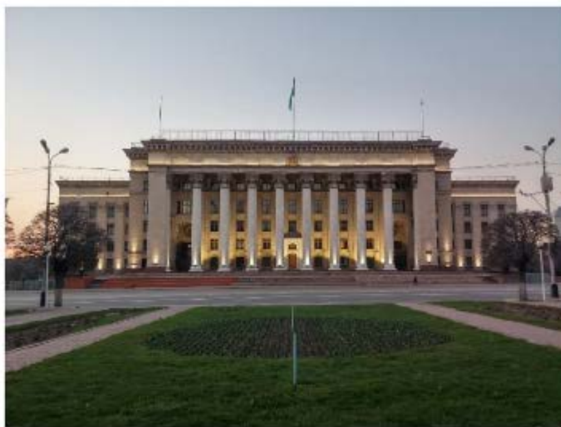
Рис. 14. Здание Казахстанско-Британского технического университета

На принадлежность объекта архитектуры к определенной эпохе в истории указывает знак времени. Здание Казахстанско-Британского технического университета (Дом Правительства на Площади Ленина, 1937–1957 гг.) стилистически относится к эпохе сталинского ампира, на что указывает ряд массивных колонн с мощными капителями, украшенными советской символикой. Сама форма здания – монументальная, символизирующая державность. Здание воздвигнуто на высоком постаменте, что придает ему дополнительную значимость [8].