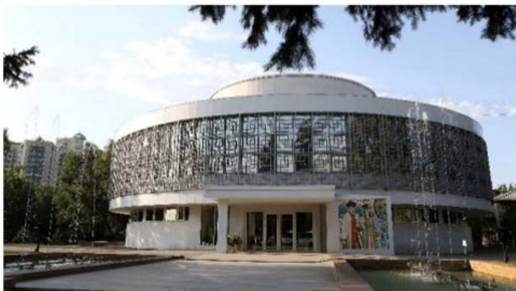
Рис. 11. Дворец бракосочетания