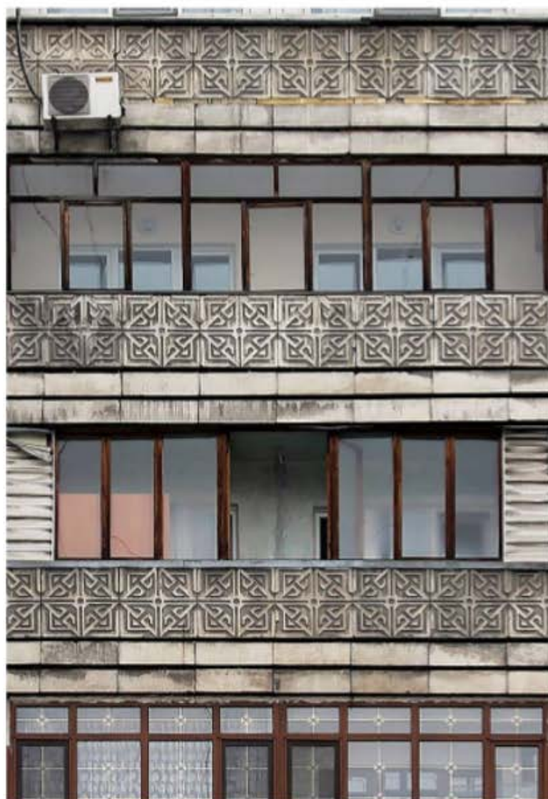
Рис. 7. Бетонные панели на балконах жилого дома