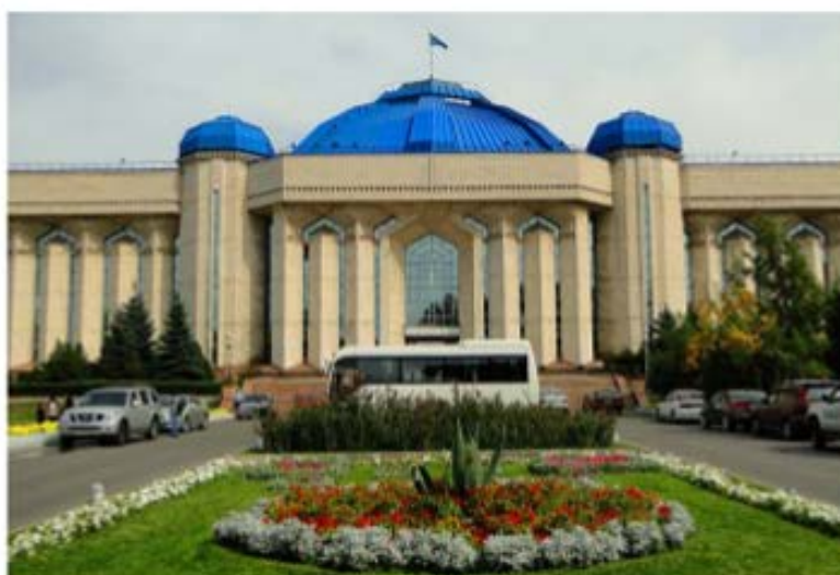
Рис. 12. Центральный государственный музей Республики Казахстан