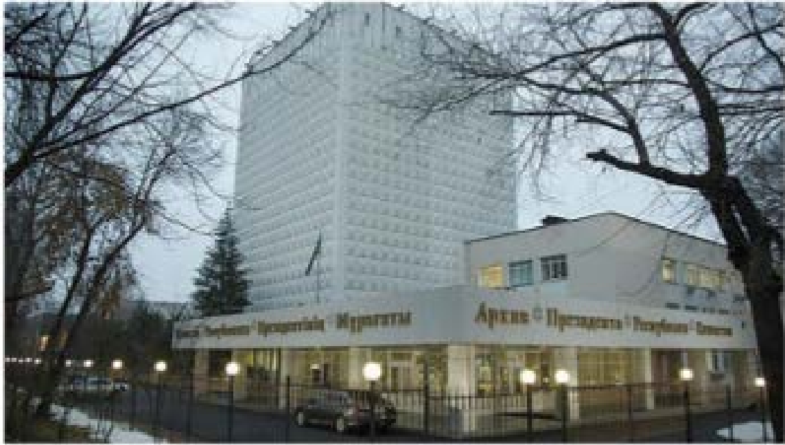
Рис. 5. Архив Президента Республики Казахстан

Знаки национальной характерности дают зрителю информацию о том, к какой национальной культуре принадлежит архитектурное произведение. Национальная принадлежность сооружения может быть обозначена четырьмя способами.