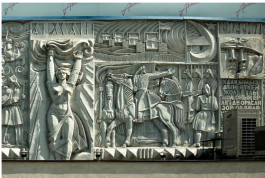
Рис. 10. Барельефы на здании кинотеатра «Арман»

При разговоре об иллюстративном способе выражения национальных особенностей в архитектуре на ум приходит Дворец бракосочетания (1966–1971 гг.). Образ здания символизирует традиционное казахское жилище – юрту. В свою очередь, юрта считается символом семейного очага. Также купола и башни по краям от главного входа Центрального государственного