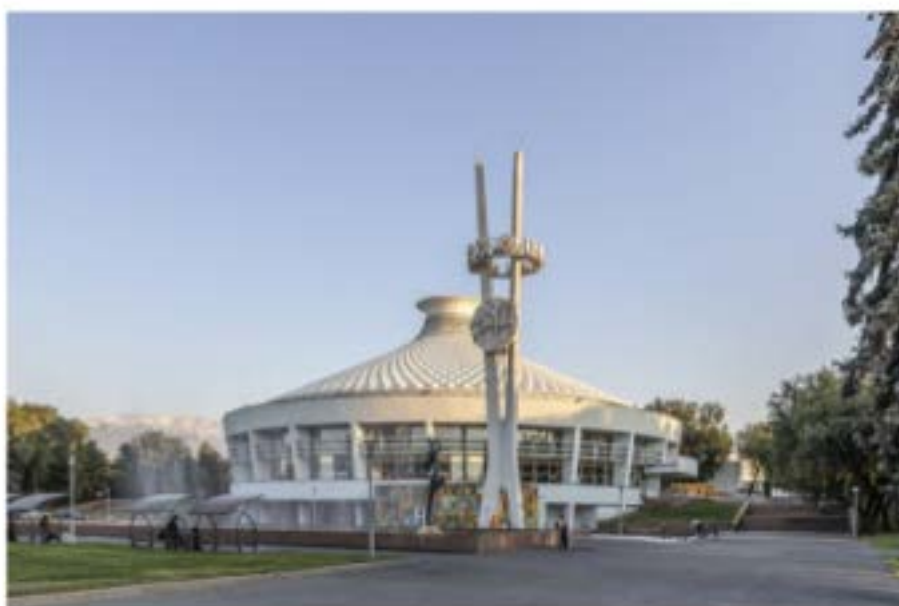
Рис. 4. Казахский государственный цирк

О назначении здания через его форму предупреждает функциональный знак. Прекрасной иллюстрацией этого можно считать здание Казахского государственного цирка (1966–1972 гг.). Архитектурный объем, выполненный из двух железобетонных колец, намекает на манеж, исполненный в традиционно круглой форме. Аналогично отсутствие оконных проемов (кроме небольших прямоугольных бойниц на верхнем этаже) на здании Архива Президента Республики Казахстан (Центральный партийный архив, 1971–1974 гг.) недвусмысленно указывает на расположение внутри некоего хранилища с особенными требованиями к освещению и внутреннему микроклимату [7].