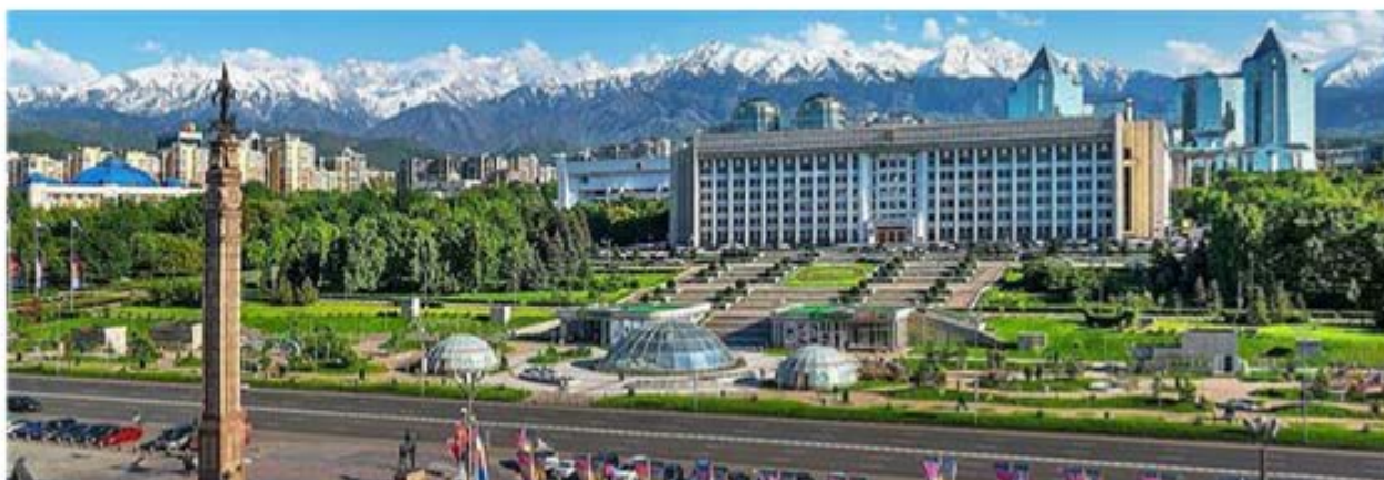
Рис. 2. Вид на Новую площадь и здание Акимата

В качестве другого примера можно привести здание Казахского театра оперы и балета имени Абая (1941 г.). Классические элементы оформления здания, такие как колонны с золотыми капителями и золотой же барельеф, изображающий сюжеты различных эпох из жизни казахского этноса, орнаментальное оформление окон и резной карниз, подготавливают к предстоящей театральной постановке. Ощущения дополняет шикарное оформление зрительного зала, кулуаров и вестибюля, выдержанного в едином архитектурном стиле с экстерьером [8].