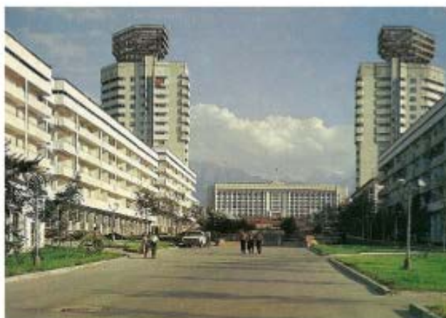
Рис. 1. Аллея по улице Байсеитовой (фото 1983 г.)

четким ритмом. Также ощущения усиливает расположение здания Акимата на высшей точке относительно всего ансамбля [7].