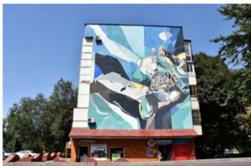
Рис. 8. Мурал на торце жилого дома