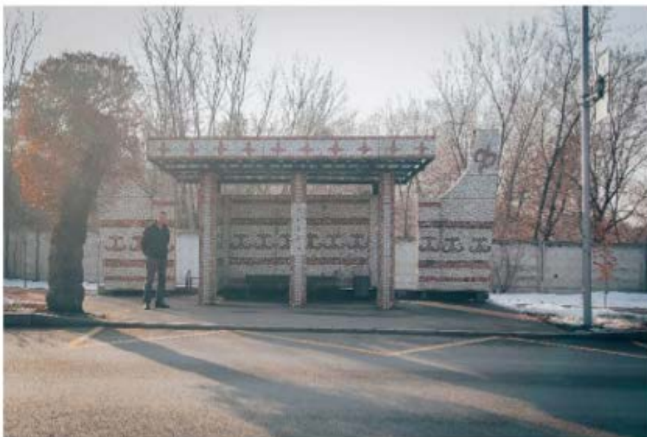
Рис. 9. Автобусная остановка