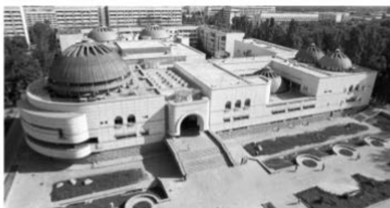
Рис. 13. Водно-оздоровительный комплекс «Арасан»