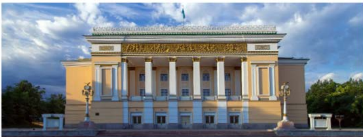
Рис. 3. Казахский театр оперы и балета им. Абая

О назначении здания через его форму предупреждает функциональный знак. Прекрасной иллюстрацией этого можно считать здание Казахского государственного цирка (1966–1972 гг.). Архитектурный объем, выполненный из двух железобетонных колец, намекает на манеж, исполненный в традиционно круглой форме. Аналогично отсутствие оконных проемов (кроме небольших прямоугольных бойниц на верхнем этаже) на здании Архива Президента Республики Казахстан (Центральный партийный архив, 1971–1974 гг.) недвусмысленно указывает на расположение внутри некоего хранилища с особенными требованиями к освещению и внутреннему микроклимату [7].